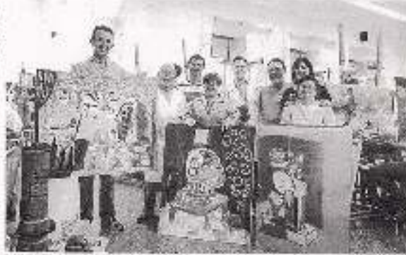
Las alumnas y alumnos con discapacidad que han formado parte del curso de Bellas Artes.

Herrera afirma que el proyecto de inclusión de personas con discapacidad intelectual en el aula de Bellas Artes de la Universidad de Granada se inició en el curso 2009-2010. Desde entonces, se ha desarrollado un proyecto de inclusión de estas personas en el aula de Bellas Artes de la Universidad de Granada.